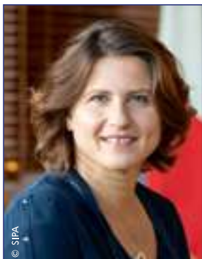
Roxana Maracineanu Ministre des Sports

Le sport est à la fois un enjeu et un symbole. Un enjeu de santé, de bien-être, d'éducation, de cohésion sociale mais aussi un symbole de liberté.